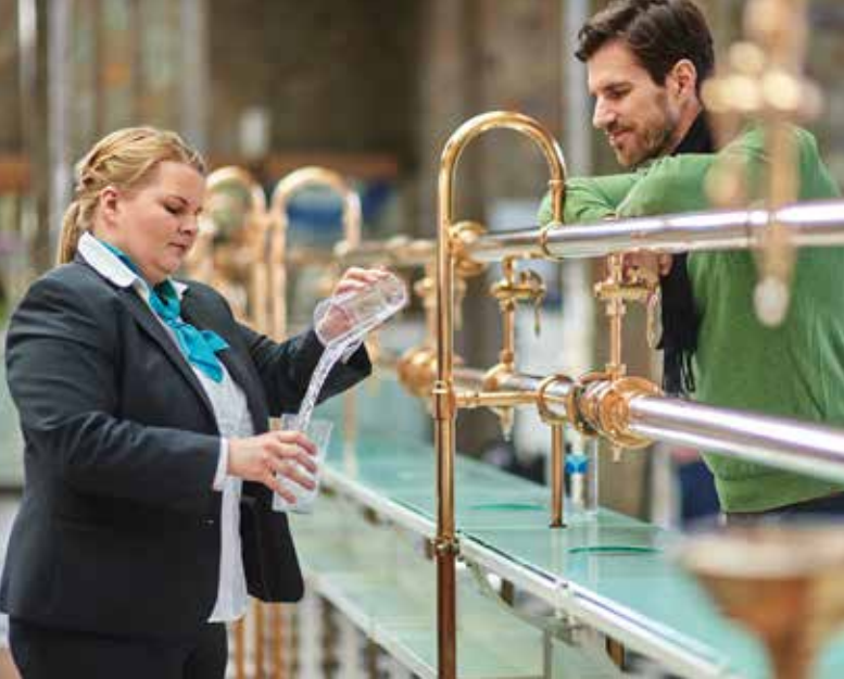
Heilwasserausschank in der Brunnenhalle Bad Kissingen