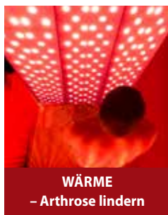
WÄRME – Arthrose lindern