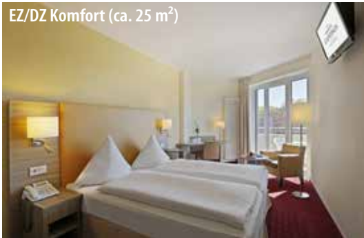
EZ/DZ Komfort (ca. 25 m 2 )