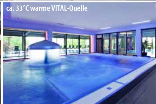
ca. 33°C warme VITAL-Quelle