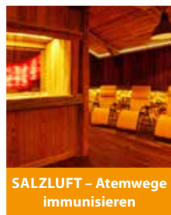
SALZLUFT – Atemwege immunisieren