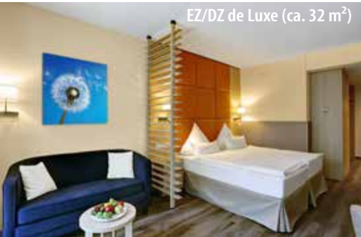
EZ/DZ de Luxe (ca. 32 m 2 )