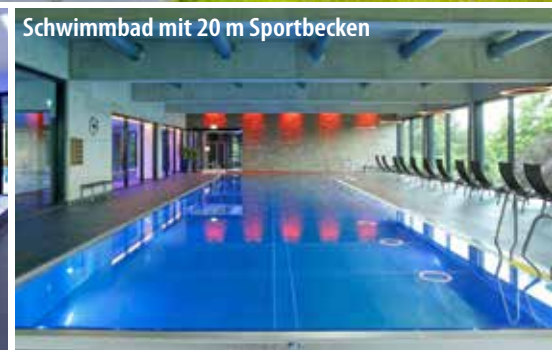
Schwimmbad mit 20 m Sportbecken

Bad Kissingen liegt an der fränkischen Saale, südlich der Rhön im Bundesland Bayern und gehört seit 2021 zum UNESCO-Welterbe „Die bedeutendsten Kurstädte Europas“. Der historische Kurort verkörpert das Phänomen der europäischen Kur auf besondere Art und Weise. Das Bild der Stadt wird vor allem durch die prächtigen Parks und die prunkvollen historischen Bauten geprägt. Hier stehen der Kurpark mit Wandelhalle und Regentebau sowie die Bayerische Spielbank hervor. Besonders sehenswert sind auch das Bismarck-Museum und die historische Altstadt mit Geschäften und typisch fränkischer Gastronomie. Mit dem CUP VITAL Service-Taxi reisen Sie ganz bequem von Zuhause ins Hotel und zurück!